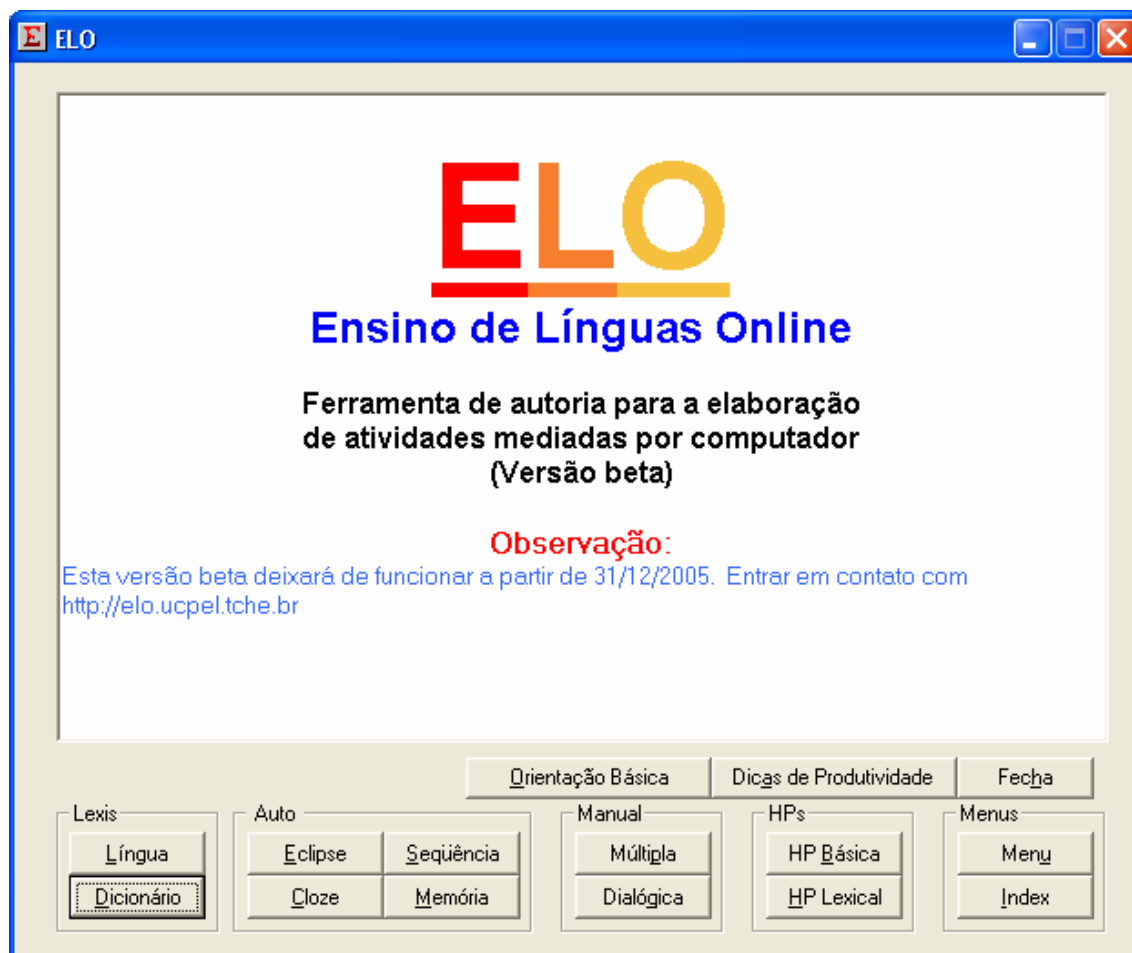
Figura 3 – Tela de abertura do sistema de autoria ELO (ambiente do professor)

Seis tipos de atividades de aprendizagem – referidas aqui como módulos – podem ser produzidas pelo sistema: