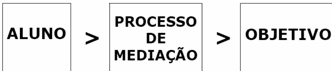
Figura 1 – Elementos básicos da Teoria da Atividade (adaptado)

O problema, como se vê, é que muitas vezes o objetivo que o professor tem em mente não coincide com o objetivo do aluno. É claro que alcançar a compatibilidade de objetivos entre o aluno e o professor nem sempre é uma tarefa fácil, mas é óbvio que cabe ao professor, pelo menos, procurar deixar o mais claro possível qual é exatamente o objetivo que ele tem em mente, ou seja, qual é a competência que ele deseja que o aluno desenvolva. Na sala de aula, tanto presencial como a distância, o objetivo normalmente envolve a apropriação pelo aluno de um determinado conteúdo. A Figura 1 mostra graficamente esses três elementos básicos, adaptados da TA.